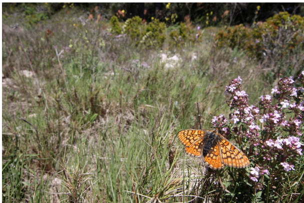
Euphydryas aurinia provincialis , Cabrières-d'Avignon