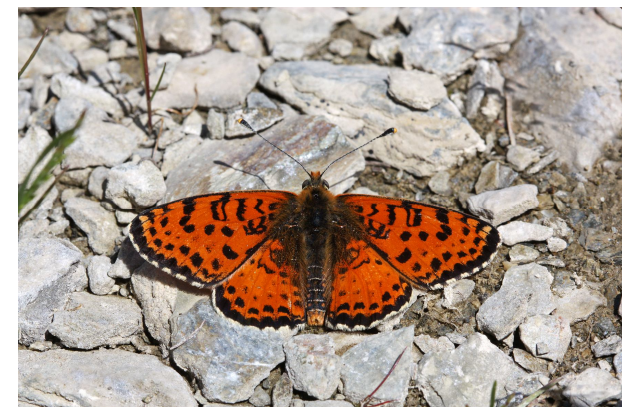
Melitaea didyma meridionalis , Bélesta