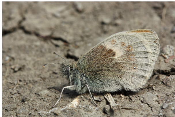
Coenonympha pamphilus , Sournia