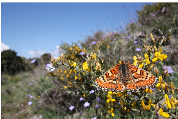
Euphydryas desfontainii pierroni , Sournia