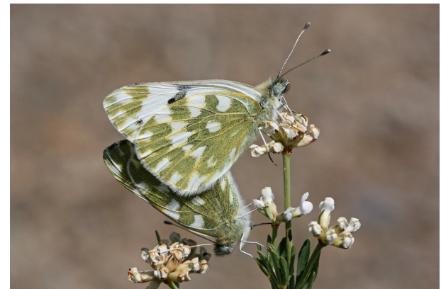
Pontia daplidice in copula, Bélesta