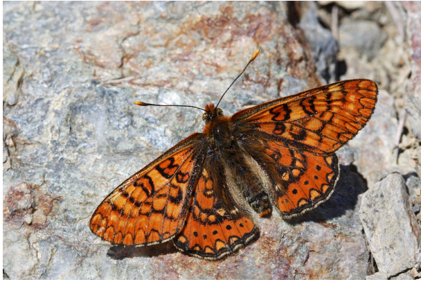
Euphydryas aurinia beckeri , Belesta