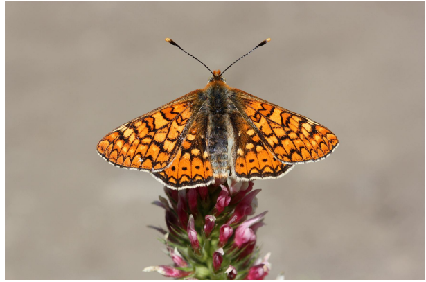
Euphydryas aurinia beckeri , Sournia